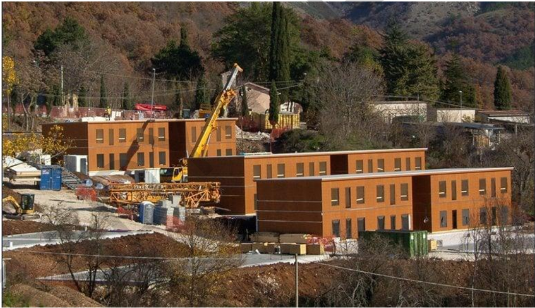
Εικόνα 5.11. Μακροχρόνια στέγαση μετά τον σεισμό στην Κεντρική Ιταλία το 2016.