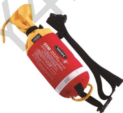
Εικόνα 5.21. Σάκος εκτόξευσης σχοινού.

Μερικά βοηθήματα πλευστότητας και σωσίβια, τα οποία είναι γνωστά και ως προσωπικές συσκευές πλεύσης ή PFDs, διαθέτουν μια «Ουρά αγελάδας». Αυτή επιτρέπει στους διασώστες να δεθούν σε ένα σχοινί. Η ουρά της αγελάδας πρέπει να μπορεί να απελευθερωθεί γρήγορα αν κριθεί απαραίτητο.