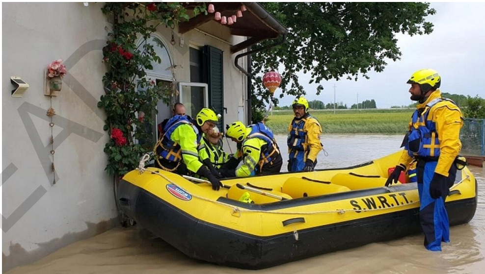
Εικόνα 5.2. Επιχειρήσεις Έρευνας και Διάσωσης μετά τις πλημμύρες της Εμίλια Ρομάνια, Ιταλία 2023.