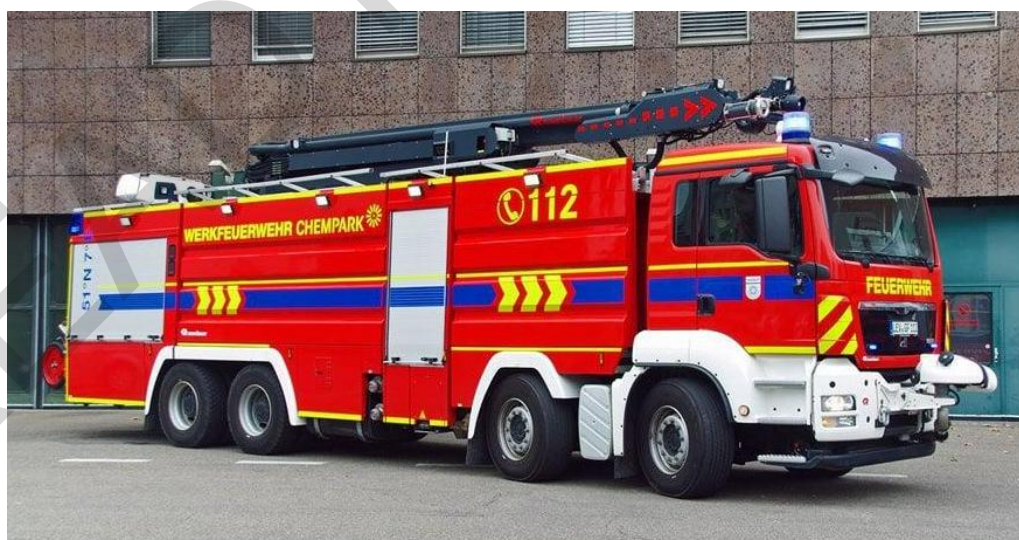
Εικόνα 5.43. Όχημα Βιομηχανικών Πυρκαγιών.

Κλιμακοφόρο Πυροσβεστικό Όχημα: Είναι ένα εξειδικευμένο πυροσβεστικό όχημα εξοπλισμένο με μια επεκτάσιμη σκάλα η οποία χρησιμοποιείται για πρόσβαση, πυρόσβεση και εκτέλεση διασώσεων σε ψηλούς ορόφους. Διαθέτει μια ευρύχωρη καμπίνα, σειρήνες και φώτα για την ανταπόκριση σε έκτακτες ανάγκες. Η επεκτάσιμη σκάλα, συχνά με ένα καλάθι ή πλατφόρμα, βοηθά στην πυρόσβεση, τις επιχειρήσεις έρευνας και διάσωσης, και στην πρόσβαση σε ψηλά κτίρια. Αυτά τα φορτηγά μπορεί επίσης να μεταφέρουν πυροσβεστικό εξοπλισμό, εργαλεία και συστήματα επικοινωνίας. Τα φορτηγά με πυροσβεστική σκάλα παίζουν ένα κρίσιμο ρόλο στις αστικές πυρκαγιές και τις αντίστοιχες επιχειρήσεις διάσωσης, προσφέροντας εμβέλεια και ευελιξία σε καταστάσεις έκτακτης ανάγκης.