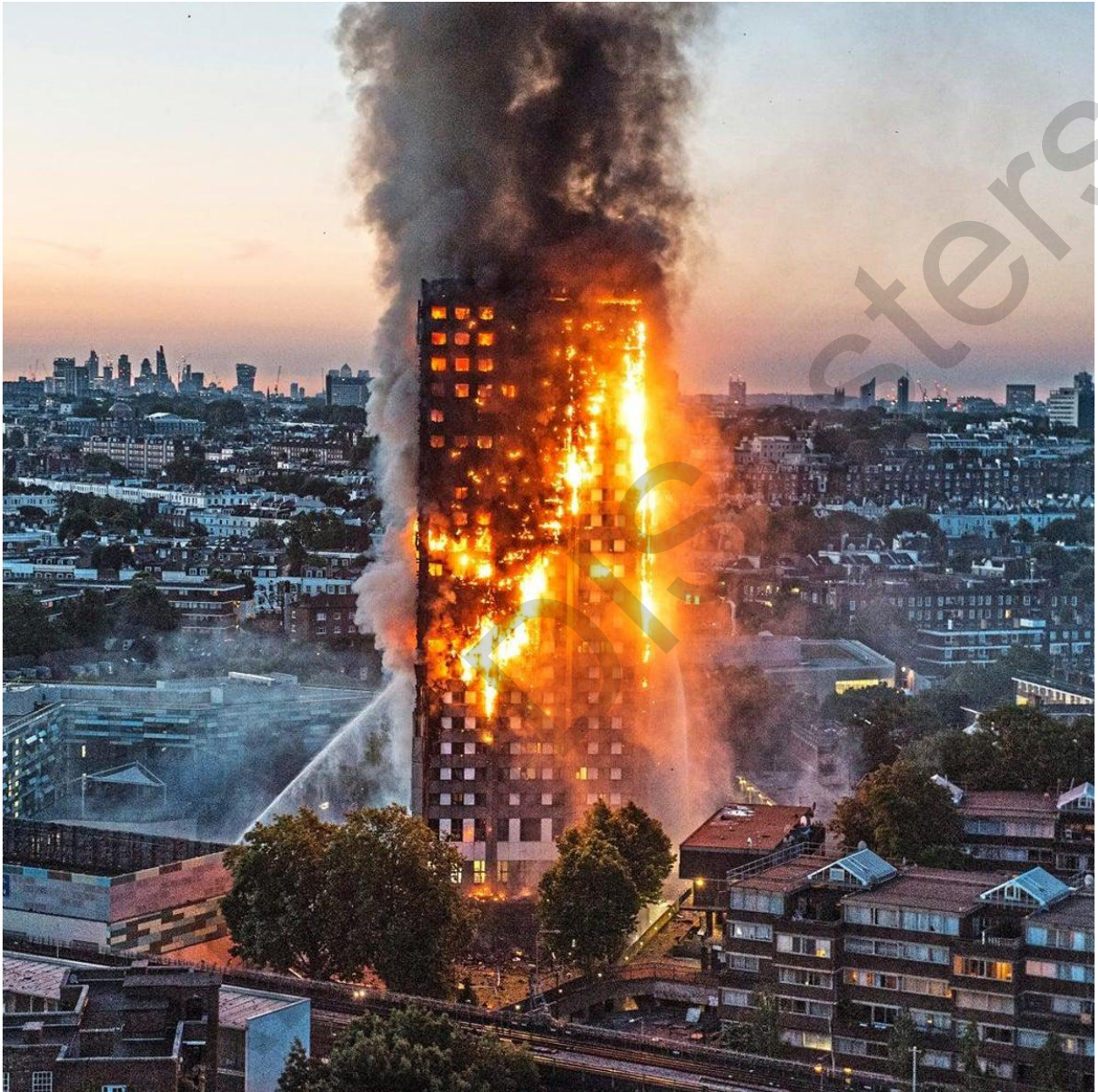
Εικόνα 5.46. Πυρκαγιά στον Πύργο Γκρένφελ.

γρήγορης και ολοκληρωμένης ανθρωπιστικής ανταπόκρισης για να αντιμετωπιστούν οι άμεσες ανάγκες εκείνων που επηρεάζονται από την καταστροφή.