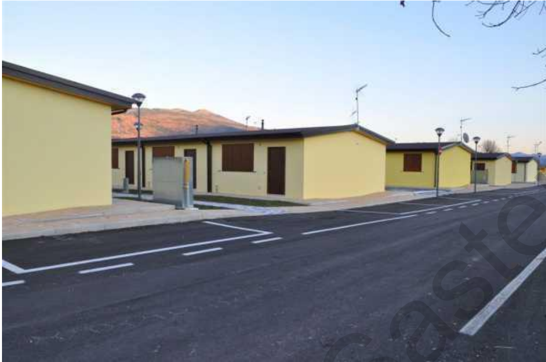
Εικόνα 5.12. Μακροπρόθεσμη στέγαση μετά τον σεισμό στην Κεντρική Ιταλία το 2016.