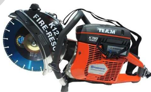
Εικόνα 5.40. Δισκοπρίονο

Διαστολέας/κόφτης: Οι διαστολές, είναι ισχυρά υδραυλικά εργαλεία τα οποία χρησιμοποιούνται για να απεγκλωβίσουν θύματα από οχήματα που έχουν εμπλακεί σε ατυχήματα, ειδικά όταν είναι παγιδευμένα λόγω οικοδομικών ζημιών ή τροχαίων ατυχημάτων. Αποτελούνται από μια υδραυλική αντλία, σωληνώσεις και εξειδικευμένα προσαρτήματα όπως διαστολές (για να απωθούν τα μέρη ενός οχήματος), κόφτες (για να κόβουν μέσα από μέταλλο) και έμβολα (για να σηκώνουν ή να ωθούν αντικείμενα). Μπορούν να κόψουν μέσα από μέταλλο, να ανοίξουν με δύναμη πόρτες οχημάτων και να παρέχουν την απαραίτητη δύναμη για να ελευθερώσουν άτομα που είναι παγιδευμένα.