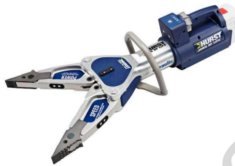
Εικόνα 5.39. Διαστολέας/κόφτης

Πυροσβεστικό Τσεκούρι: Το πυροσβεστικό τσεκούρι είναι ένα ειδικό τσεκούρι που έχει σχεδιαστεί για επιχειρήσεις πυρόσβεσης και διάσωσης. Συνήθως διαθέτει μια κοφτερή λεπίδα στη μία πλευρά της κεφαλής και ένα επίπεδο, συχνά οδοντωτό στην άλλη πλευρά. Οι πυροσβέστες χρησιμοποιούν την κοφτερή λεπίδα για κόψιμο/ ξύλωμα ενώ το αιχμηρό άκρο χρησιμοποιείται για απομάκρυνση και τράβηγμα υλικών όπως ξύλο, γυψοσανίδα ή στέγη.