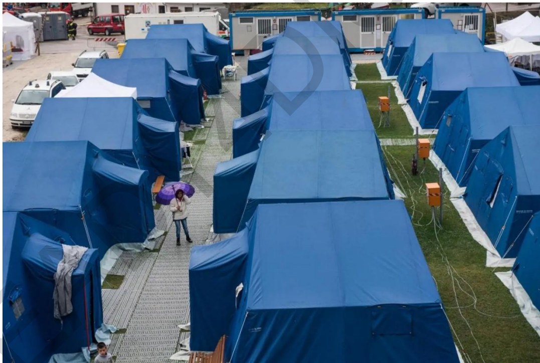
Εικόνα 5.9. Προσωρινή στέγαση σε σκηνές, Ιταλία.