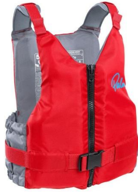
Εικόνα 5.14. Σωσίβιο μπουφάν.

Σωσίβιο μπουφάν: Το σωσίβιο μπουφάν, γνωστό επίσης ως βοηθητικό μέσο πλευστότητας ή προσωπική συσκευή πλεύσης (PFD), είναι ένας τύπος ενδύματος ασφαλείας στο νερό που σχεδιάστηκε για να παρέχει πλευστότητα και να βοηθήσει τα άτομα να επιπλέουν στο νερό. Τα σωσίβια μπουφάν είναι συνήθως μικρότερου όγκου από τα σωσίβια και χρησιμοποιούνται συχνά σε δραστηριότητες όπως η κωπηλασία, η ιστιοπλοΐα και το κανό. Παρέχουν πλευστότητα αλλά δεν είναι σχεδιασμένα για να περιστρέφουν έναν αναισθητο άνθρωπο με το πρόσωπο προς τα πάνω στο νερό. Τα σωσίβια μπουφάν είναι πιο άνετα και προσφέρουν ελευθερία κίνησης.