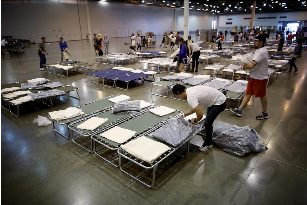
Εικόνα 5.10. Προσωρινή στέγαση σε αθλητικό κτίριο.