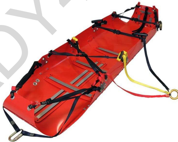
Εικόνα 5.36. Φορείο καλάθι.

Τσάντα πρώτων βοηθειών: Είναι ένα φορητό δοχείο σχεδιασμένο να περιέχει ποικιλία εφοδίων και εξοπλισμού πρώτων βοηθειών για άμεση ιατρική βοήθεια. Αυτές οι τσάντες υπάρχουν σε διάφορα μεγέθη και διαμορφώσεις, από μικρά και συμπαγή σετ για προσωπική χρήση μέχρι μεγαλύτερα και πιο ολοκληρωμένα σετ που χρησιμοποιούνται από πρώτους ανταποκριτές και επαγγελματίες υγείας. Μία καλά εξοπλισμένη τσάντα πρώτων βοηθειών περιέχει συνήθως επιδέσμους, αντισηπτικά, ιατρικά εργαλεία και άλλα εφόδια για την αντιμετώπιση τραυματισμών και ιατρικών εκτάκτων αναγκών.