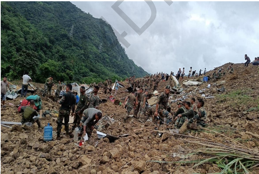
Εικόνα 5.5. Έρευνα & Διάσωση μετά από κατολίσθηση.