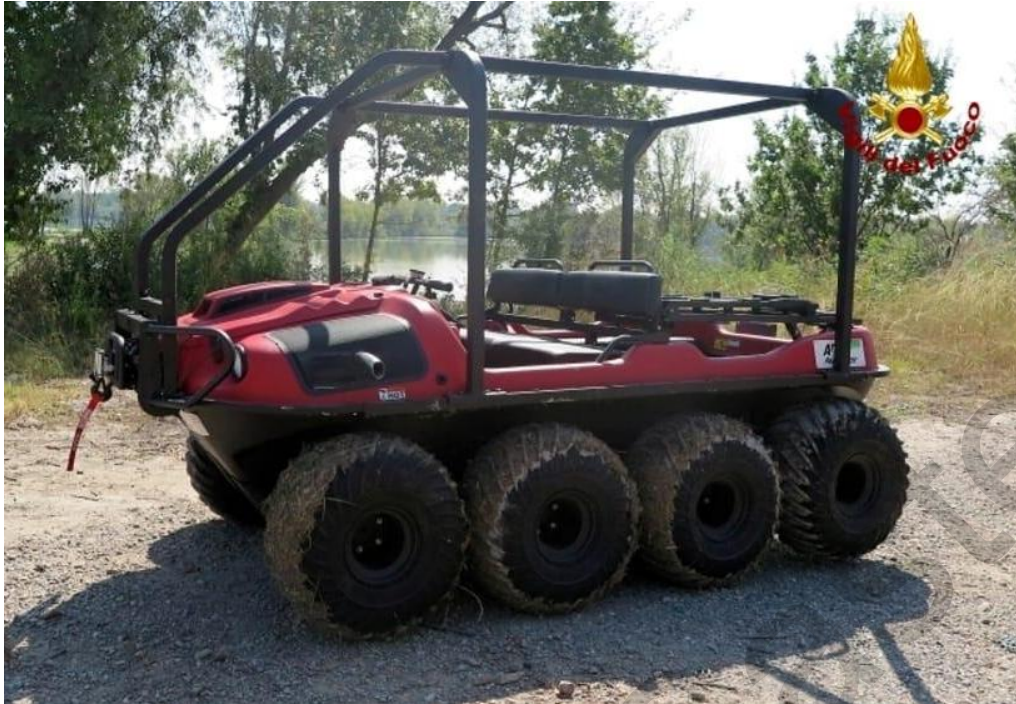
Εικόνα 5.27. Ειδικό όχημα για διάσωση από πλημμύρες.