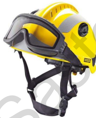
Εικόνα 5.29. Κράνος διάσωσης.

Η στολή διάσωσης , που φοριέται από πυροσβέστες και προσωπικό διάσωσης, είναι ειδικός προστατευτικός εξοπλισμός σχεδιασμένος για επιχειρήσεις απεγκλωβισμού οχημάτων και διάσωσης σε επικίνδυνα περιβάλλοντα. Κατασκευασμένο από ανθεκτικά υλικά όπως το κέβλαρ, παρέχει κάλυψη σε ολόκληρο το σώμα, προστατεύοντας από αιχμηρές άκρες, θραύσματα γυαλιού και άλλους κινδύνους που συναντώνται κατά τις εργασίες απεγκλωβισμού και διάσωσης. Αυτές οι στολές διαθέτουν ανακλαστικές λωρίδες και συχνά περιλαμβάνουν τσέπες για τη μεταφορά πρακτικών εργαλείων. Αν και δεν προσφέρουν την ίδια αντοχή στη θερμότητα με τις στολές πυρόσβεσης, προσφέρουν σχετική προστασία από τις φλόγες.