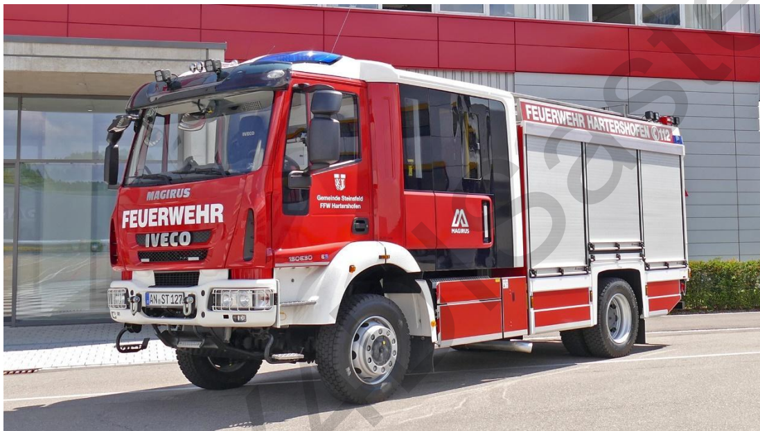
Εικόνα 5.41. Πυροσβεστικό Όχημα.

συναντώνται συχνά σε καταστάσεις έκτακτης ανάγκης. Οι πυροσβέστες χρησιμοποιούν τα πυροσβεστικά δισκοπρίονα για εργασίες όπως το κόψιμο τοίχων, στεγών και συντριμμιών ώστε να φτάσουν σε θύματα ή να δημιουργήσουν οπές αερισμού σε φλεγόμενα κτίρια.