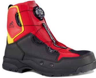
Εικόνα 5.18. Αδιάβροχες μπότες ασφαλείας για διάσωση στο νερό.

Διαθέτουν εκτός από ένα στρογγυλεμένο άκρο και μια οδοντωτή ή αιχμηρή ακμή για ευέλικτη κοπή σε καταστάσεις έκτακτης ανάγκης.