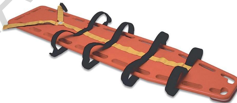
Εικόνα 5.33. Σανίδα σπονδυλικής στήριξης.