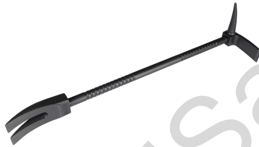
Εικόνα 5.37. Γάντζος halligan.

Γάντζος Halligan: Ο γάντζος Halligan, είναι ένα πολυεργαλείο βίαιης εισόδου που χρησιμοποιείται από πυροσβέστες και προσωπικό διάσωσης. Συνήθως αποτελείται από ένα διακλαδισμένο άκρο, ένα άκρο ανάτασης και μια σταδιακά στενευμένη αιχμή. Το εργαλείο είναι σχεδιασμένο για να ανοίγει με δύναμη πόρτες, παράθυρα και άλλα εμπόδια σε καταστάσεις έκτακτης ανάγκης. Οι πυροσβέστες το χρησιμοποιούν για να αποκτήσουν πρόσβαση σε κτήρια, οχήματα και περιορισμένους χώρους.