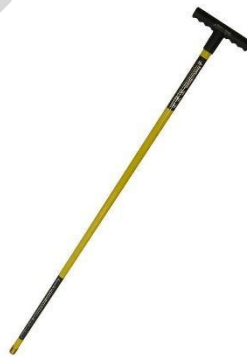
Εικόνα 5.19. Κοντάρι υποστήριξης για διάβαση σε ρηγά νερά.

Αδιάβροχες μπότες ασφαλείας για διάσωση στο νερό: Οι αδιάβροχες μπότες ασφαλείας για διάσωση στο νερό είναι ειδικά σχεδιασμένα υποδήματα που σκοπό έχουν να παρέχουν προστασία και υποστήριξη στο προσωπικό διάσωσης. Κατασκευασμένες από ανθεκτικά και αδιάβροχα υλικά, όπως το νεοπρένιο ή το καουτσούκ, αυτές οι μπότες προσφέρουν μόνωση από το νερό και προστασία από κινδύνους σε υδάτινα περιβάλλοντα. Συνήθως διαθέτουν αντιολισθητικές σόλες για πρόσφυση σε υγρές συνθήκες και ενισχυμένα δάχτυλα για ανθεκτικότητα στις κρούσεις. Είναι απαραίτητες για τη διατήρηση σταθερού βαδίσματος και την προστασία των ποδιών κατά τη διάρκεια επιχειρήσεων διάσωσης βασιζόμενων στο νερό.