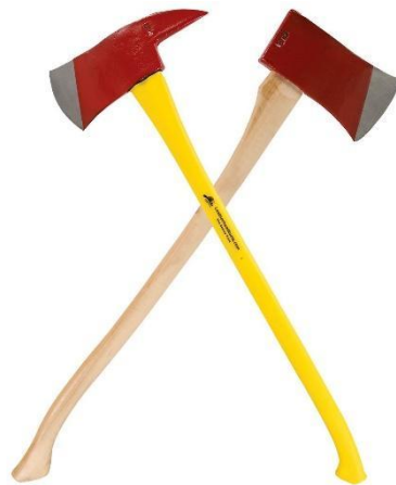
Εικόνα 5.38. Πυροσβεστικό Τσεκούρι.

Γάντζος Halligan: Ο γάντζος Halligan, είναι ένα πολυεργαλείο βίαιης εισόδου που χρησιμοποιείται από πυροσβέστες και προσωπικό διάσωσης. Συνήθως αποτελείται από ένα διακλαδισμένο άκρο, ένα άκρο ανάτασης και μια σταδιακά στενευμένη αιχμή. Το εργαλείο είναι σχεδιασμένο για να ανοίγει με δύναμη πόρτες, παράθυρα και άλλα εμπόδια σε καταστάσεις έκτακτης ανάγκης. Οι πυροσβέστες το χρησιμοποιούν για να αποκτήσουν πρόσβαση σε κτήρια, οχήματα και περιορισμένους χώρους.