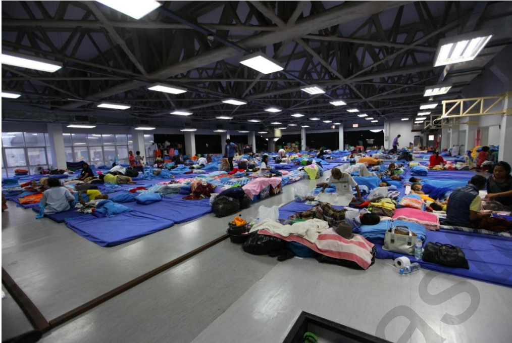
Εικόνα 5.8. Προσωρινή στέγαση σε δημόσια εγκατάσταση.