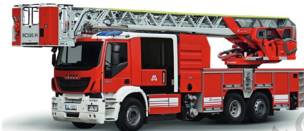
Εικόνα 5.42. Κλιμακοφόρο Πυροσβεστικό Όχημα

Κλιμακοφόρο Πυροσβεστικό Όχημα: Είναι ένα εξειδικευμένο πυροσβεστικό όχημα εξοπλισμένο με μια επεκτάσιμη σκάλα η οποία χρησιμοποιείται για πρόσβαση, πυρόσβεση και εκτέλεση διασώσεων σε ψηλούς ορόφους. Διαθέτει μια ευρύχωρη καμπίνα, σειρήνες και φώτα για την ανταπόκριση σε έκτακτες ανάγκες. Η επεκτάσιμη σκάλα, συχνά με ένα καλάθι ή πλατφόρμα, βοηθά στην πυρόσβεση, τις επιχειρήσεις έρευνας και διάσωσης, και στην πρόσβαση σε ψηλά κτίρια. Αυτά τα φορτηγά μπορεί επίσης να μεταφέρουν πυροσβεστικό εξοπλισμό, εργαλεία και συστήματα επικοινωνίας. Τα φορτηγά με πυροσβεστική σκάλα παίζουν ένα κρίσιμο ρόλο στις αστικές πυρκαγιές και τις αντίστοιχες επιχειρήσεις διάσωσης, προσφέροντας εμβέλεια και ευελιξία σε καταστάσεις έκτακτης ανάγκης.