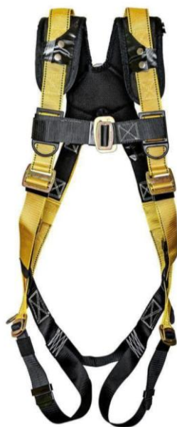
Εικόνα 5.32. Ζώνη ασφαλείας.

Ζώνη ασφαλείας: Η ζώνη ασφαλείας είναι μέρος του εξοπλισμού προστασίας από πτώσεις και χρησιμοποιείται σε επιχειρήσεις διάσωσης, ιδιαίτερα σε σενάρια που συμπεριλαμβάνουν εργασία σε ύψη ή στενούς χώρους. Οι ζώνες συνήθως κατασκευάζονται από ιμάντες υψηλής αντοχής και περιλαμβάνουν ρυθμιζόμενους ιμάντες και πόρτες για μια ασφαλή και άνετη εφαρμογή. Διαθέτουν σημεία πρόσδεσης για σύνδεση με συνδετήρες ή άλλα συστήματα σύλληψης κατά την πτώση. Οι ζώνες ασφαλείας κατανέμουν τη δύναμη μιας πτώσης σε όλο το σώμα, προλαμβάνοντας τραυματισμούς και επιτρέποντας στους διασώστες να εργάζονται με ασφάλεια και σιγουριά σε υψηλά περιβάλλοντα.