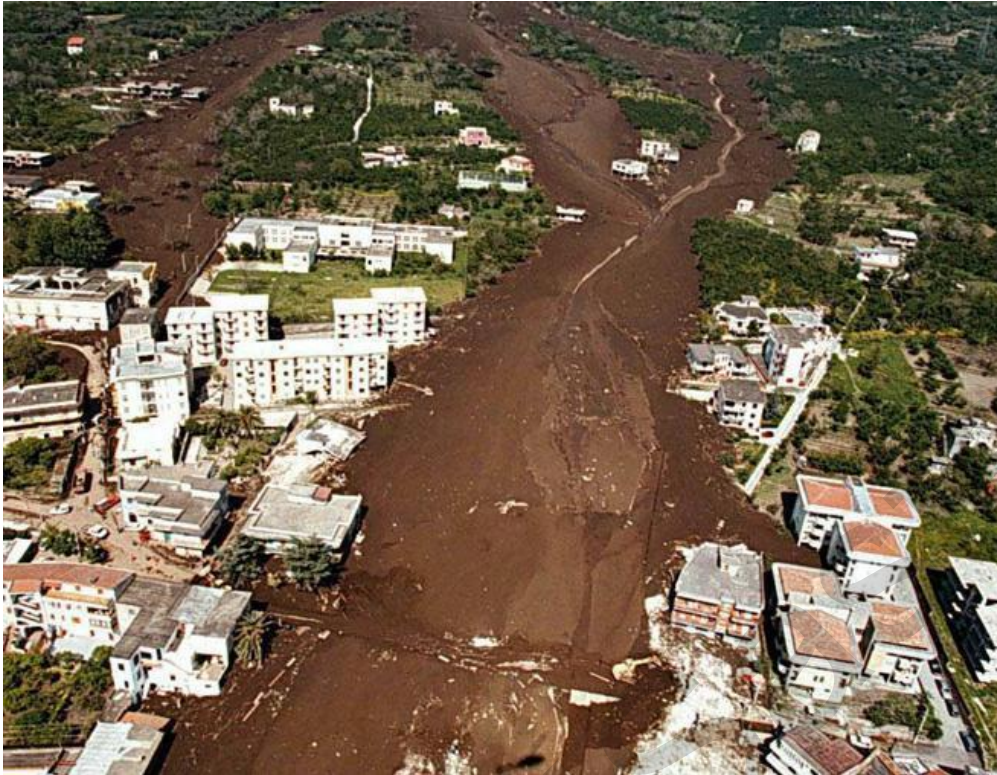
Εικόνα 5.45. Αεροφωτογραφία του Σάρνο.