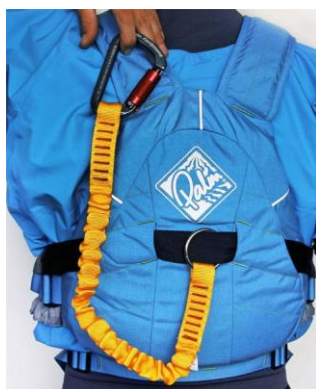
Εικόνα 5.20. Ουρά αγελάδας (σε αυτό το πλαίσιο, αναφέρεται σε ένα ειδικό λουρί ασφαλείας που χρησιμοποιείται στη διάσωση).

Μερικά βοηθήματα πλευστότητας και σωσίβια, τα οποία είναι γνωστά και ως προσωπικές συσκευές πλεύσης ή PFDs, διαθέτουν μια «Ουρά αγελάδας». Αυτή επιτρέπει στους διασώστες να δεθούν σε ένα σχοινί. Η ουρά της αγελάδας πρέπει να μπορεί να απελευθερωθεί γρήγορα αν κριθεί απαραίτητο.