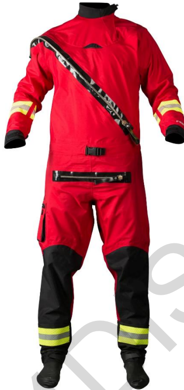
Εικόνα 5.13. Στεγανή στολή για πλημμύρες.

Στεγανή στολή: Η στεγανή στολή χρησιμοποιείται από τις ομάδες έκτακτης ανάγκης κατά τις επιχειρήσεις που σχετίζονται με πλημμύρες. Κατασκευάζεται από αδιάβροχα υλικά όπως το Gore-Tex ή το νεοπρένιο και παρέχει πλήρη προστασία του σώματος από την βύθιση στα νερά της πλημμύρας. Το κοστούμι συνήθως περιλαμβάνει αδιάβροχα φερμουάρ, στεγανότητα στους καρπούς και το λαιμό και ενσωματωμένες μπότες για να εξασφαλίζεται η μόνωση από το νερό. Κουκούλα και γάντια από νεοπρένιο ενδέχεται επίσης να αποτελούν μέρος του συνόλου. Το στεγανό κοστούμι επιτρέπει στους διασώστες να εργάζονται με ασφάλεια σε πλημμυρισμένες περιοχές, προστατεύοντάς τους από το μολυσμένο νερό, τις χαμηλές θερμοκρασίες και τους άλλους δυνητικούς κινδύνους. Είναι ένα απαραίτητο κομμάτι εξοπλισμού για τις ομάδες διάσωσης σε ορμητικά νερά, διασφαλίζοντας την αποτελεσματικότητά τους σε δύσκολες συνθήκες πλημμύρας.