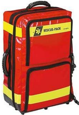
Εικόνα 5.35. Τσάντα πρώτων βοηθειών.

Τσάντα πρώτων βοηθειών: Είναι ένα φορητό δοχείο σχεδιασμένο να περιέχει ποικιλία εφοδίων και εξοπλισμού πρώτων βοηθειών για άμεση ιατρική βοήθεια. Αυτές οι τσάντες υπάρχουν σε διάφορα μεγέθη και διαμορφώσεις, από μικρά και συμπαγή σετ για προσωπική χρήση μέχρι μεγαλύτερα και πιο ολοκληρωμένα σετ που χρησιμοποιούνται από πρώτους ανταποκριτές και επαγγελματίες υγείας. Μία καλά εξοπλισμένη τσάντα πρώτων βοηθειών περιέχει συνήθως επιδέσμους, αντισηπτικά, ιατρικά εργαλεία και άλλα εφόδια για την αντιμετώπιση τραυματισμών και ιατρικών εκτάκτων αναγκών.