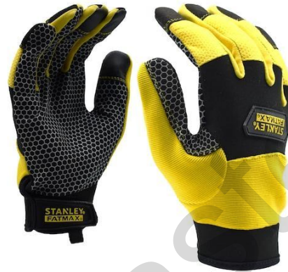
Εικόνα 5.31. Γάντια ασφαλείας.

Μπότες Ασφαλείας: Οι μπότες ασφαλείας για επιχειρήσεις διάσωσης είναι ανθεκτικά και προστατευτικά υποδήματα που σχεδιάστηκαν για να διατηρούν τα πόδια ασφαλή σε διάφορα σενάρια διάσωσης. Συνήθως κατασκευάζονται από ανθεκτικά υλικά όπως το δέρμα ή σύνθετα υλικά, προσφέροντας προστασία έναντι αιχμηρών αντικειμένων, ηλεκτρισμού και κραδασμών. Η άνεση και η υποστήριξη είναι προτεραιότητα, καθιστώντας τις κατάλληλες για μακροχρόνια χρήση κατά τη διάρκεια των επιχειρήσεων διάσωσης.