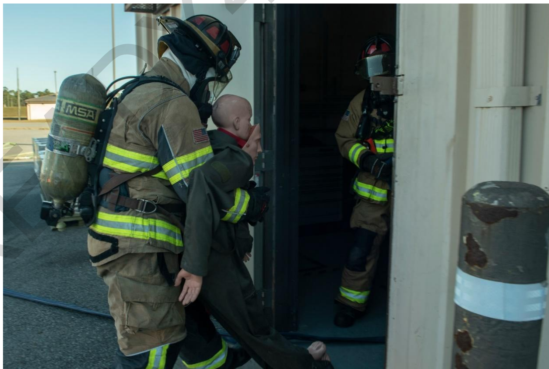
Εικόνα 5.7. Εκπαίδευση πυροσβεστών σε εκκένωση. ΗΠΑ.

Εάν οι συνθήκες της πυρκαγιάς το επιτρέπουν, οι πυροσβέστες θα διεξάγουν μια συστηματική επιχείρηση έρευνας και διάσωσης, εισερχόμενοι στο κτίριο φορώντας κατάλληλο προστατευτικό εξοπλισμό και παίρνοντας τα απαραίτητα μέτρα. Κινούνται από δωμάτιο σε δωμάτιο, ελέγχοντας για εγκλωβισμένα άτομα και καθοδηγώντας τα προς ασφάλεια. Οι πυροσβέστες έχουν εκπαιδευτεί να παραμένουν χαμηλά για να αποφεύγουν τη ζέστη και τον καπνό, χρησιμοποιώντας θερμικές κάμερες για να πλοηγηθούν μέσα στη μειωμένη ορατότητα.