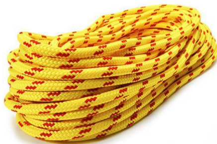
Εικόνα 5.22. Σχοινί διάσωσης για χρήση στο νερό.