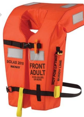
Εικόνα 5.15. Σωσίβιο

Σωσίβιο μπουφάν: Το σωσίβιο μπουφάν, γνωστό επίσης ως βοηθητικό μέσο πλευστότητας ή προσωπική συσκευή πλεύσης (PFD), είναι ένας τύπος ενδύματος ασφαλείας στο νερό που σχεδιάστηκε για να παρέχει πλευστότητα και να βοηθήσει τα άτομα να επιπλέουν στο νερό. Τα σωσίβια μπουφάν είναι συνήθως μικρότερου όγκου από τα σωσίβια και χρησιμοποιούνται συχνά σε δραστηριότητες όπως η κωπηλασία, η ιστιοπλοΐα και το κανό. Παρέχουν πλευστότητα αλλά δεν είναι σχεδιασμένα για να περιστρέφουν έναν αναισθητο άνθρωπο με το πρόσωπο προς τα πάνω στο νερό. Τα σωσίβια μπουφάν είναι πιο άνετα και προσφέρουν ελευθερία κίνησης.