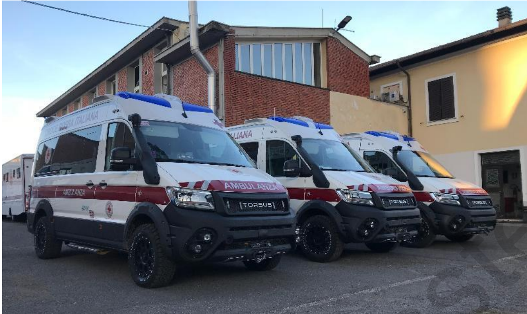
Εικόνα 5.25. Ειδικά ασθενοφόρα για διάσωση από πλημμύρες.