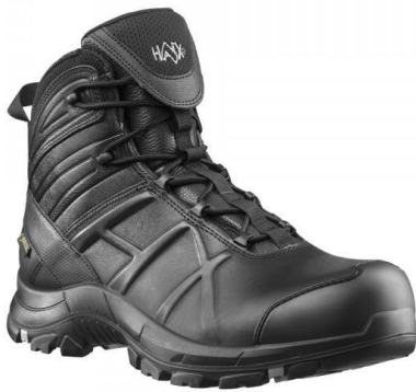
Εικόνα 5.30. Μπότες Ασφαλείας.

γυαλιά, για να προστατεύουν τα μάτια από τα συντρίμμια και τους κινδύνους. Επιπλέον, συχνά διαθέτουν υποδοχές για την προσάρτηση φακών ή συσκευών επικοινωνίας, διασφαλίζοντας την πολυχρηστικότητα και την ασφάλεια σε ποικίλα περιβάλλοντα διάσωσης.