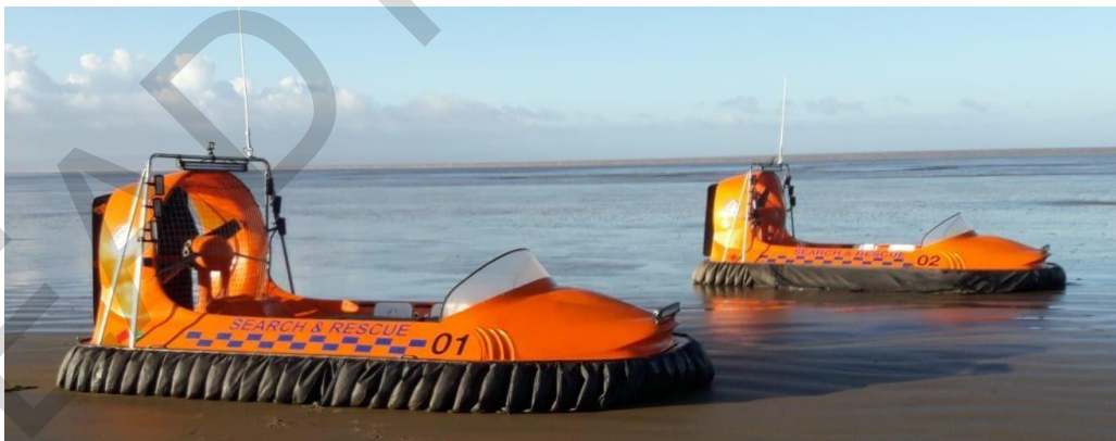
Εικόνα 5.24. Σκάφη διάσωσης.

Ειδικά/αμφίβια οχήματα που μπορούν να πλοηγηθούν τόσο στη στεριά όσο και στο νερό, καθιστώντας τα ανεκτίμητα για αποστολές σε περιοχές με πλημμυρισμένο έδαφος ή με υψηλά επίπεδα νερού.