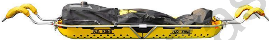
Εικόνα 5.34. Φορείο που στηρίζεται στον ώμο.

Σανίδα σπονδυλικής στήριξης: Μία σανίδα σπονδυλικής στήριξης, γνωστή και ως σανίδα πλάτης, είναι μια στερεή, μακριά και επίπεδη ιατρική συσκευή που χρησιμοποιείται για την ακινητοποίηση ατόμων με υποψία τραυματισμών της σπονδυλικής στήλης. Συνήθως φτιάχνεται από ελαφριά αλλά ανθεκτικά υλικά όπως πλαστικό ή σύνθετα υλικά. Χρησιμοποιούνται ζώνες ασφαλείας για να εξασφαλιστεί ότι ο ασθενής είναι σταθερά στερεωμένος στη σανίδα, διατηρώντας τη σπονδυλική στήλη ευθυγραμμισμένη. Οι σανίδες σπονδυλικής στήριξης χρησιμοποιούνται συχνά κατά την εξαγωγή και μεταφορά τραυματιών ασθενών για να αποτρέψουν περαιτέρω βλάβη στη σπονδυλική στήλη.