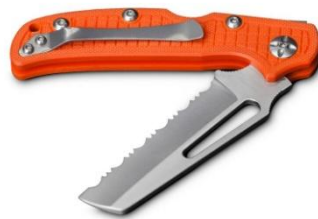
Εικόνα 5.17. Σουγιάς ασφαλείας.

Κράνος ασφαλείας για επιχειρήσεις σε ύδατα: Είναι ένα εξειδικευμένο κράνος που σχεδιάστηκε για άτομα που ασχολούνται με δραστηριότητες σχετικές με το νερό και με διασωστικές επιχειρήσεις. Συνήθως κατασκευάζεται από ελαφρά και ανθεκτικά υλικά όπως πλαστικό υψηλής αντοχής ή ίνες γυαλιού, έτσι ώστε να προσφέρει προστασία από κρούσεις και να επιπλέει. Συχνά διαθέτει ρυθμιζόμενα λουριά και συστήματα αερισμού. Οι φωσφορίζοντες αποχρώσεις το κάνουν κατάλληλο για επαγγελματίες βελτιώνοντας την αναγνώριση του ατόμου μέσα στο νερό.