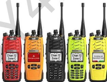
Εικόνα 5.23. Αδιάβροχοι ασύρματοι.

Τα συστήματα επικοινωνίας για την ανταπόκριση σε πλημμύρες αποτελούν κρίσιμα εργαλεία που επιτρέπουν τον αποτελεσματικό συντονισμό μεταξύ των διασωστών, των οργανισμών και των πληγέντων κοινοτήτων. Περιλαμβάνουν μια σειρά από τεχνολογίες, όπως αδιάβροχοι ασύρματοι, δορυφορικά τηλέφωνα και δίκτυα κινητής τηλεφωνίας. Αυτά τα συστήματα επιτρέπουν τη διάχυση πληροφοριών σε πραγματικό χρόνο, επιτρέποντας στους ανταποκριτές να μεταδίδουν προειδοποιήσεις για πλημμύρες, ενημερώσεις καιρού και οδηγίες εκκένωσης. Αυτές οι συσκευές είναι σχεδιασμένες έτσι να είναι ανθεκτικές στο νερό.