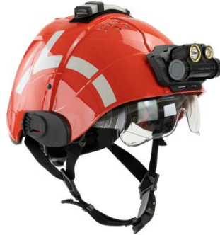
Εικόνα 5.16. Κράνος ασφαλείας.

φουσκωτά και υβριδικά. Χαρακτηρίζονται από την υψηλή πλευστότητα τους και περιλαμβάνουν έναν γιακά ή υποστήριξη κεφαλιού για να διατηρούν το κεφάλι του ατόμου έξω από το νερό.