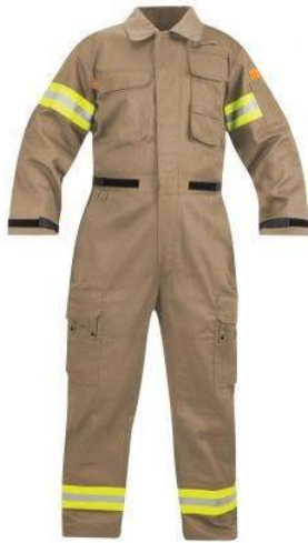
Εικόνα 5.28. Στολή διάσωσης.