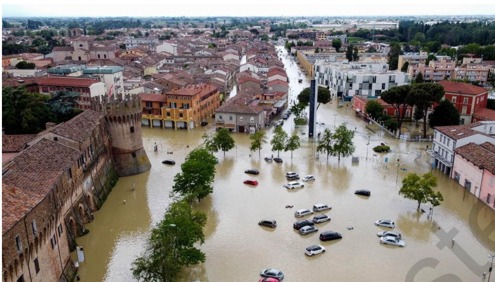
Εικόνα 5.44. Αεροφωτογραφία πλημμυρισμένης πόλης στην Εμίλια-Ρομάνια.