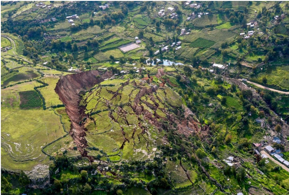
Εικόνα 5.3. Αεροφωτογραφία κατολίσθησης.