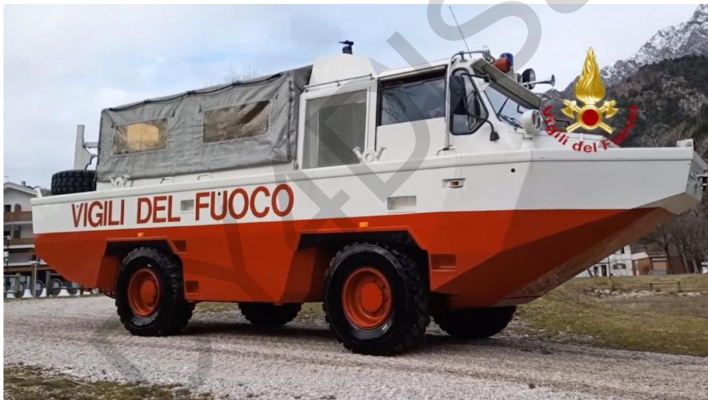
Εικόνα 5.26. Αμφίβιο φορτηγό.