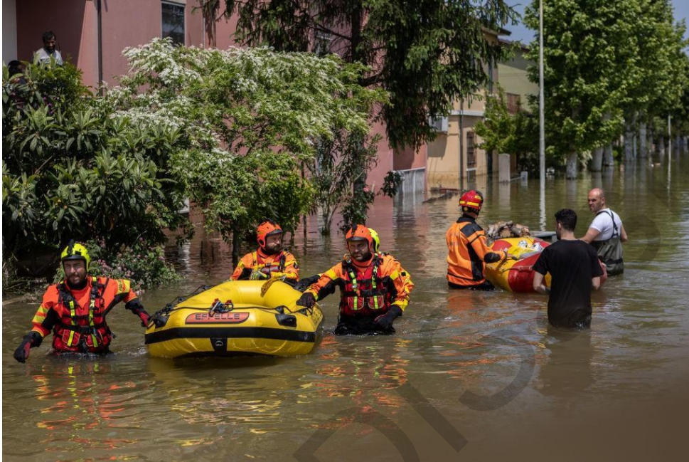
Εικόνα 5.1. Επιχειρήσεις Έρευνας και Διάσωσης μετά τις πλημμύρες της Εμίλια Ρομάνια, Ιταλία 2023.

ανακούφισης ώστε να μειωθεί η ταλαιπωρία τους. Οι επιχειρήσεις ανακούφισης μπορεί να περιλαμβάνουν την εγκατάσταση εκτάκτων εγκαταστάσεων, τη διανομή βοήθειας, τη μεταφορά τραυματιών, καθώς και την αποκατάσταση δημόσιων εγκαταστάσεων και σπιτιών στις πληγείσες περιοχές.